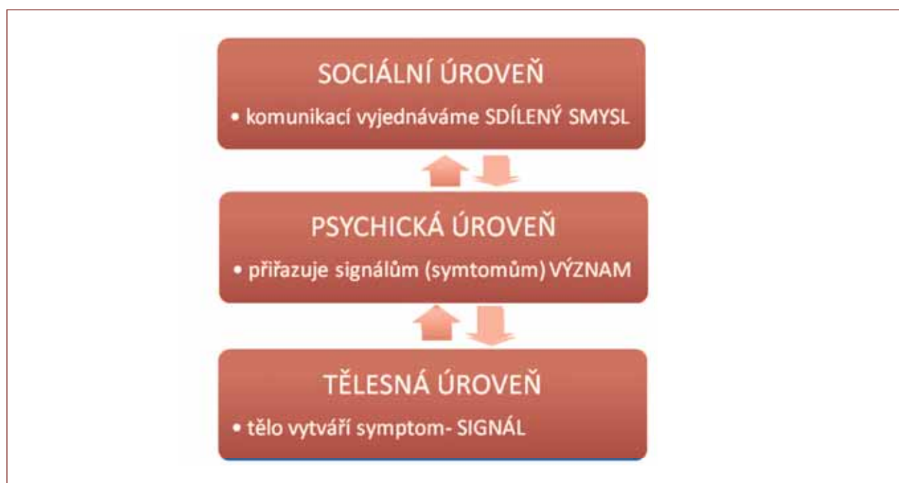
Tabulka 4: Vrstvy bio-psycho-sociální reality člověka

K úplné anamnéze je nutné prozkoumat všechny dimenze symptomu ve smyslu bio-psycho-sociálního přístupu, tj. jeho somatický, psychický (tj. kognitivní a emocionální), i sociální (tj. behaviorální a vztahový) rozměr. Je třeba si uvědomit provázanost všech těchto vrstev. Tělesná úroveň vytváří signál ve formě příznaku, na psychické rovině vzniká jeho zpracování, pacient přiřazuje příznaku význam v jeho životním příběhu, tento význam spouští emoční reakci podle osobních zkušeností člověka. Svým chováním a komunikací člověk pak ovlivňuje a spoluvytváří sociální vrstvu a kulturu, která má zpětně vliv na to, jak lze symptomům rozumět, vyjednáváme smysl symptomu. Z didaktických důvodů pojednáme jednotlivé dimenze zvlášť, už proto, aby lékař žádnou z nich neopomíjel.